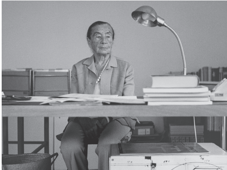
Giorgio Hoch, Bez názvu (Lucia Moholy), kolem 1980. S laskavým svolením umělce. Copyright: © Giorgio Hoch.