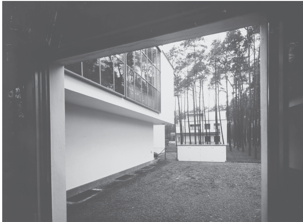
Lucia Moholy, Pohled z okna Lucie Moholy, Desava, 1926. Fotostiftung Schweiz, Winterthur. Copyright: Lucia Moholy © OOA-S 2024 / Fotostiftung Schweiz, Winterthur.